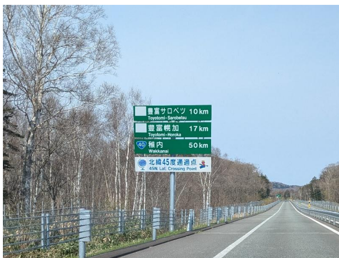
(写真：北緯 45 度通過点をしめす看板)